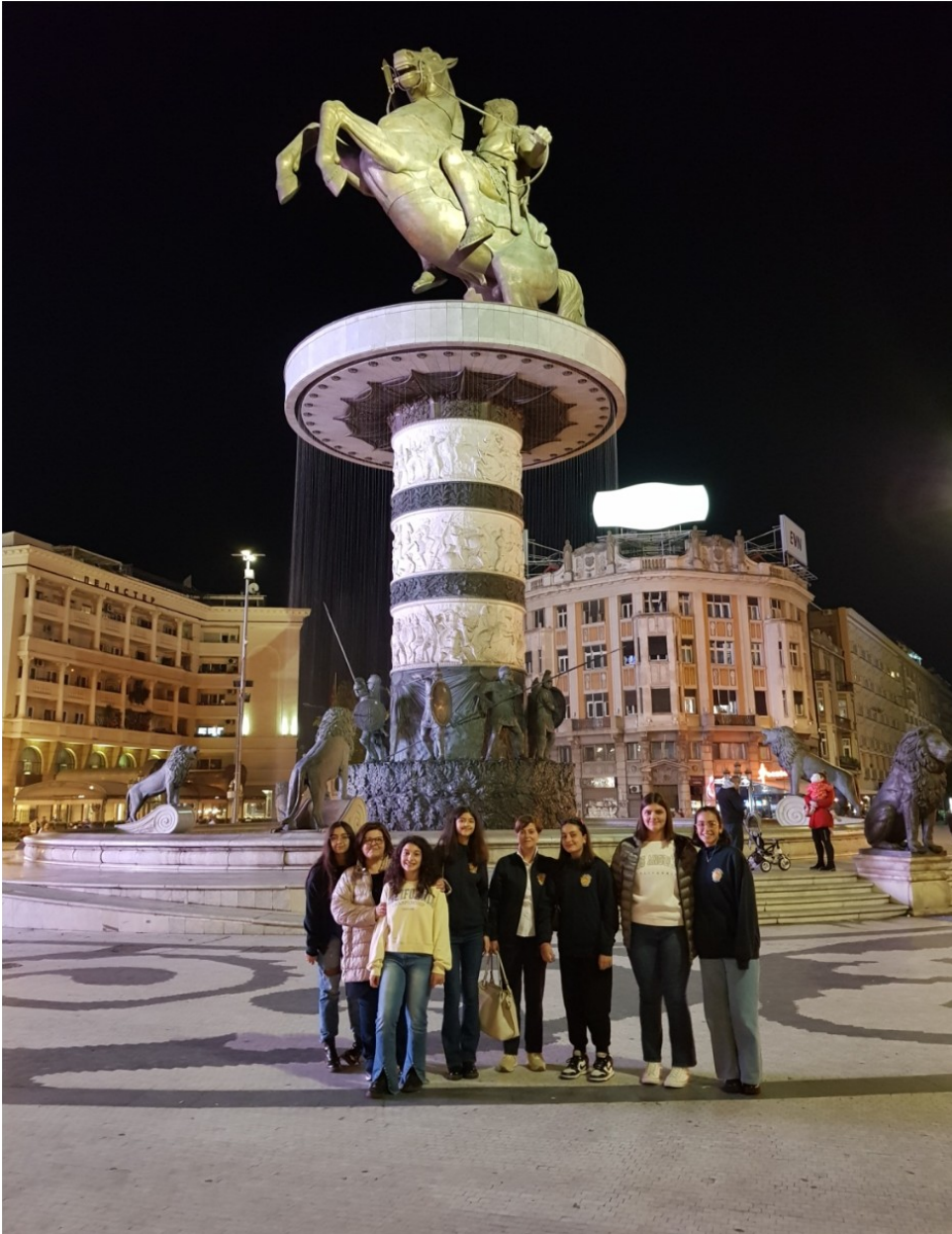
Qui siamo in Piazza Macedonia che si affaccia sul fiume Vardar e al cui centro spicca la gigantesca statua di bronzo, chiamata “ Guerriero a cavallo”, che ritrae Alessandro Magno.